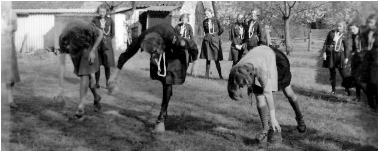
Bloempotrace bij het clubhuis

Niet veel mensen weten dat Diepenveen aan de wieg stond van de meisjespadvinderij in Overijssel. Wie wel eens wandelt in het Kolkbos, kent vast wel de blokhut van een bloeiende scoutinggroep die daar staat, maar die is nog niet zo oud. In die blokhut zetelt sinds 1964 de al in 1927 in Deventer opgerichte President Steijngroep. Er ontstonden in de begintijd van de padvinderij een paar groepen in Deventer, waaronder de Westenenkgroep op de Platvoet uit 1917, allemaal alleen toegankelijk voor jongens.