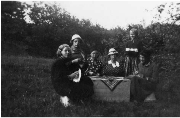
Toneelstukje tijdens een Mokuno kamp in Ommen