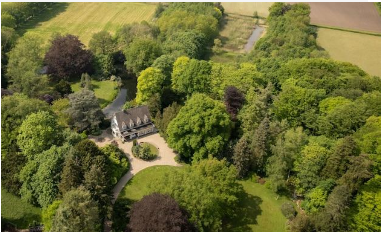
Roobrug, nog een keer vanuit de lucht.