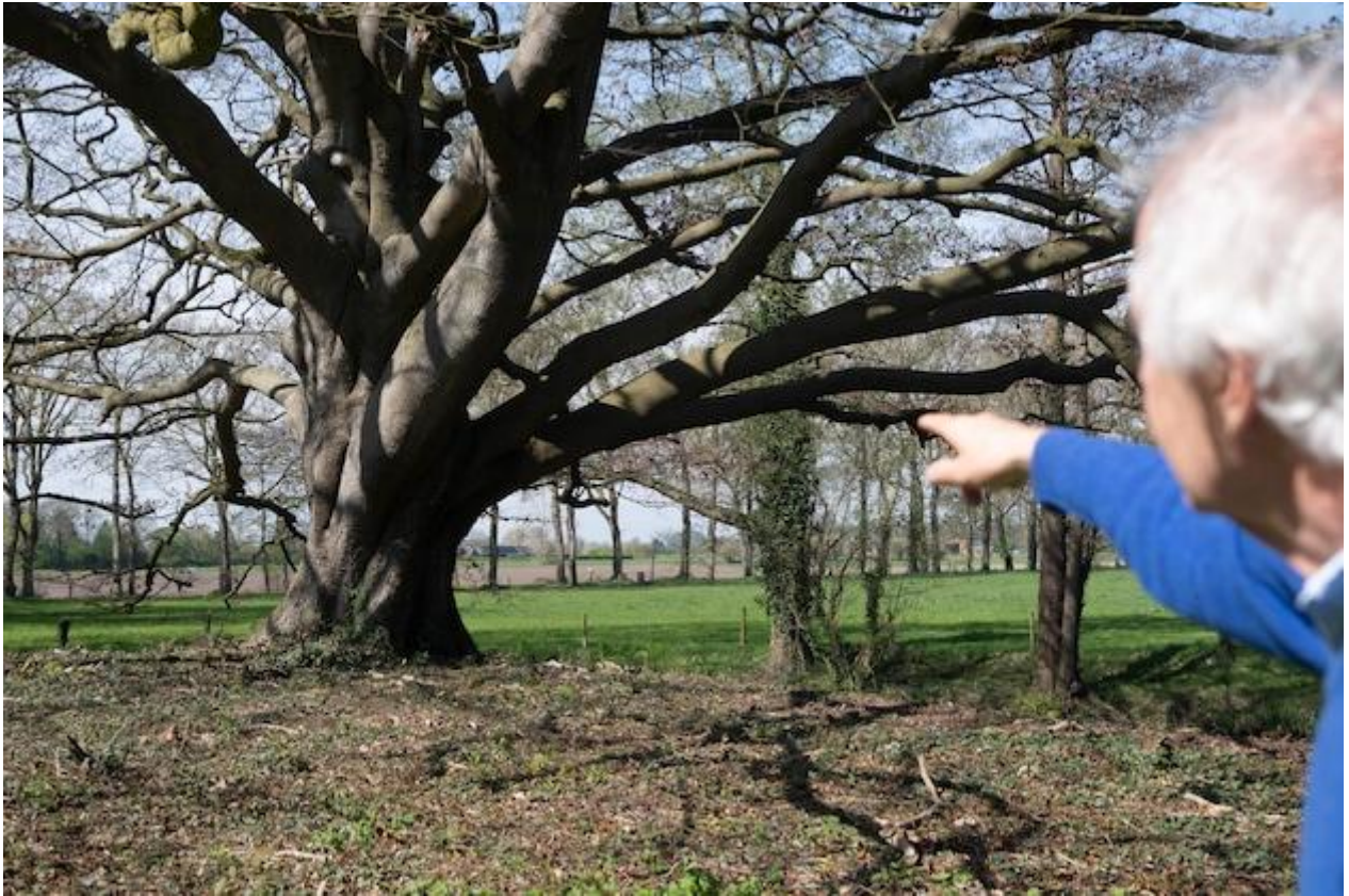
Kolossale boom op het landgoed.

De Diepenvener hoopt dat het landgoed aan de Sallandsweg in goede handen blijft. Dat hij zeer begaan is met Roobrug, blijkt uit het boek, een uitgebreidere versie van een eerste uitgave uit 2019.