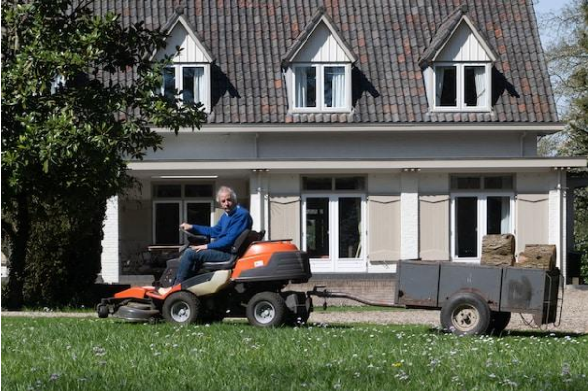
Aan het werk op het landgoed.

De landsadel en de kerk hadden het tot dan toe voor het zeggen op het platteland. De stedelijke elite had de macht in de stad. Maar stadse families vestigden zich in het buitengebied, op zoek naar ruimte en rust. Ook op Roobrug.