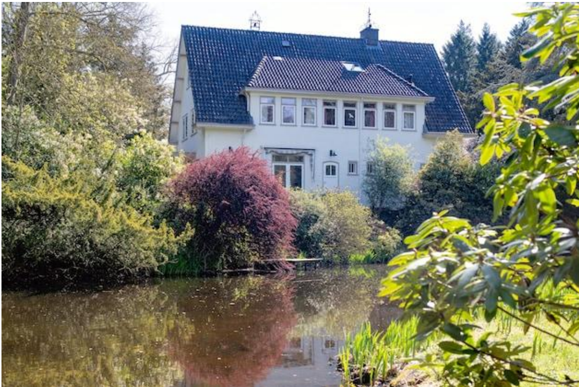
Het huidige landhuis.

Met het overlijden van de betrokkenen stierf ook het conflict.