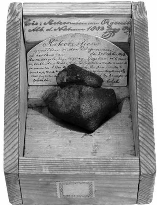
DM1: De Diepenveen meteoriet in haar speciale vurenhoutenkistje zoals deze jarenlang op de voormalige Rijks HBS in Deventer tentoongesteld stond