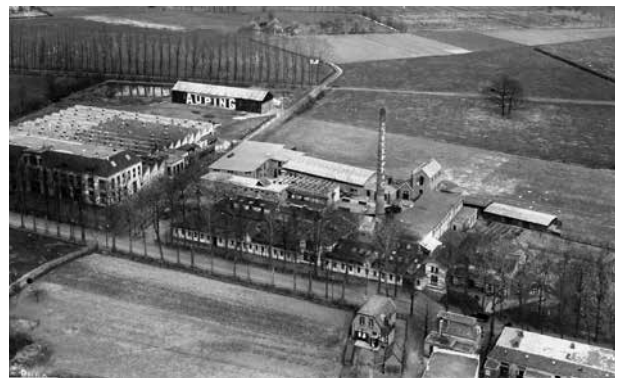
Luchtfoto van Stegeman in Borgele in 1929. De 35 meter hoge schoorsteen is in 1935 geplaatst. Links de fabriek van Auping.