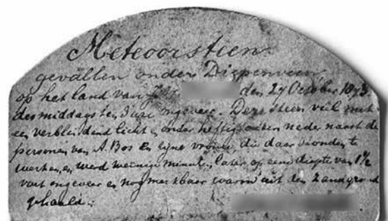
DM2: Het kartonnen labeltje welke de meteoriet in haar kistje vergezelt. De precieze locatie van de val wordt hierop ook afgeschermd zodat deze moeilijk te achterhalen is.