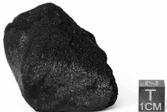
DM3: De Diepenveen. Zo groot als een kindervuist, 68 gram en 4,6 miljard jaar oud