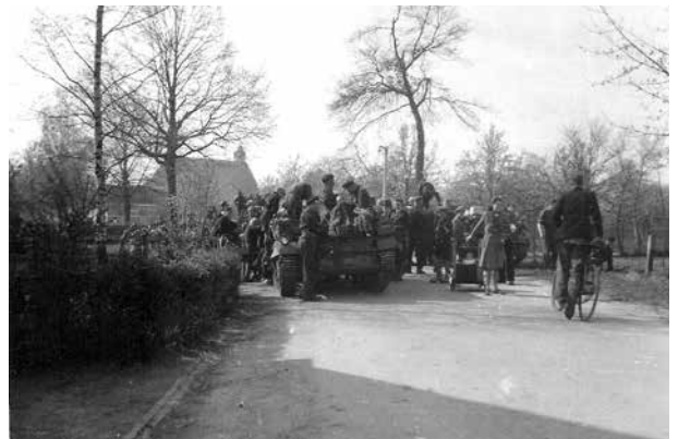
5 Mei 1945: Zaterdagmorgen om 8 uur was heel Nederland vrij. Ook in Diepenveen was er feest. Optocht, muziek, dansen. Een voetbalmatch tussen D.S.C. en een Engels elftal. Na vijf jaar onder de moffen te zijn geweest, eindelijk weer vrij. Lang leve ons vrije Nederland. Lang leve ons geliefd Oranjehuis."

mocht mee in een tank. Hij kreeg direct een revolver. Dat was een enig gezicht. Een half uurtje later kwamen ze terug. Toen moest ik de accordeon halen en mijnheer speelde het Wilhelmus en het God save the King. Daarna moest ik met twee Canadezen naar Sandhof om ze "a nice bath" te geven. Sandhof was no 1 met de vlag. Iedereen tooide zich zo gauw mogelijk met Oranje en was dadelijk op z'n Paasbest gekleed om toch maar niets mis te laten gaan. 's Middags hebben we met de Canadezen gepraat en twee kwamen 's avonds naar Sandhof. Mijnheer en mevrouw waren er ook bij. We hebben met hen door de kamers gehost en door de tuin. Om elf uur gingen we nog met een heel stel door het dorp vaderlandse liederen zingen. Het was een dag om nooit te vergeten.