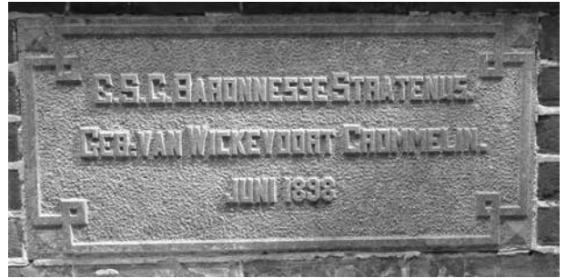
Gevelsteen in het huis Schapenzandweg 7. De initialen kloppen niet en hadden 'E.C.S.' moeten zijn.