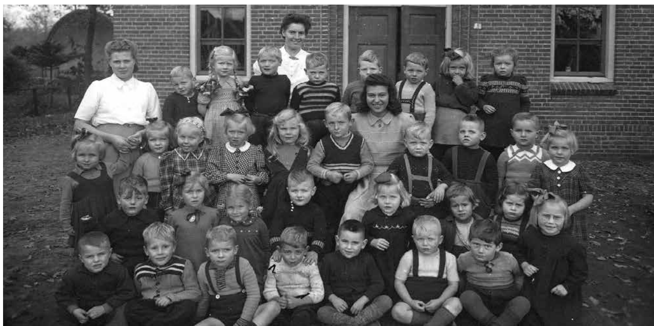
Schoolklas Slingerbos 1949

frouw v.d. Wal komt dan als leidster werken en later, toen de school groeide, ook juffrouw Kamphuis.