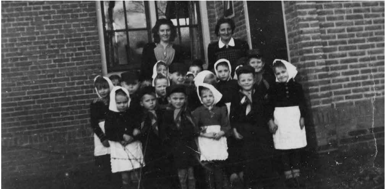
Schoolklas Slingerbos 1945

Op 15 mei 1946 konden de kleuters uit Diepenveen voor het eerst in hun eigen dorp naar school, op dezelfde tijden als de lagere school; 's ochtends van 9-12 uur en 's middags van 2-4 uur. Op zaterdagmiddag 18 mei, 's middags om 16.00 uur vindt de officiële opening plaats van de bijzondere kleuterschool Diepenveen, waarvoor ook de Gemeenteraad van Diepenveen wordt uitgenodigd.