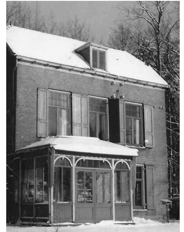
Huize Koershof zoals ooit aan Bouwhuisweg nr 2 gelegen.

hoogte gesteld is. De nogal kort aangeboden huurder zint dat helemaal niet en laat duidelijk weten dat hij voortaan graag van te voren wil weten, wanneer er weer gejaagd gaat worden. De kennelijk nogal gepiekerde baron reageert daarop nogal uit de hoogte: “Het zijn mijn jagers en daarmee hebt u niets te maken.” Er ontstaat al gauw een soort van stille oorlog tussen deze twee botsende karakters en het komt nooit meer goed. Het gevolg is wel dat de baron het vertikt om ook maar iets aan onderhoud te doen, wat de staat van het huis niet ten goede komt. Anderzijds heeft de baron ook niet het lef om de huur ook maar iets te verhogen. Het huis mag dan romantisch en als een soort van Pipi Langkous-huis ogen, comfortabel is het beslist niet. “Eigenlijk is het een gek huis”, zegt Sjoukje. “De slaapkamer van m’n ouders stond eigenlijk op de helft van een verdieping met daaronder een kelder en een keuken, voor de helft in de grond verzonken”. Er is weliswaar een centrale verwarming in het huis aangelegd, maar die doet het niet. Naast het keukenfornuis is de kolenkachel in de huiskamer de enige verwarmingsbron, waar ze ‘s winters allemaal om heen zitten. Het gezin telt dan inmiddels al zes kinderen, want in de Hongerwinter van 1944 is nog een tweeling geboren. Bij de rest van de kamers zitten ‘s winters de bloemen op de ramen. “Bij storm kon je niet slapen van