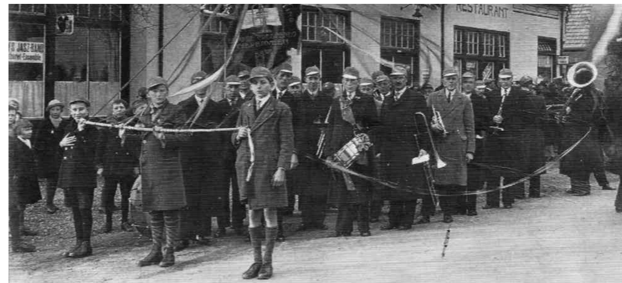
Tienjarig bestaan in 1933. Rondgang in het dorp. De schooljeugd droeg linten die met het vaandel verbonden waren als teken van saamhorigheid.

Dat de ingezetenen de waarde van zang en muziek onderkennen, blijkt ook wel als in 1932 aan de muziekvereniging en de twee bestaande zangverenigingen een muziektent wordt aangeboden. Deze is geplaatst in het Slingerbos, daar waar nu het huis Slingerbos 8 staat. De muziektent heeft de vorm van een halfronde koepel. Voor de muziektent is een grasveld waar het publiek kan zitten. Probleem is dat de toeschouwers volop van de muzikale klanken kunnen genieten, maar dat de muzikanten alle onderlinge contact missen en elkaar absoluut niet kunnen horen. Zodoende neemt de animo om daar op te treden in de loop der jaren af. In de jaren zestig wordt het