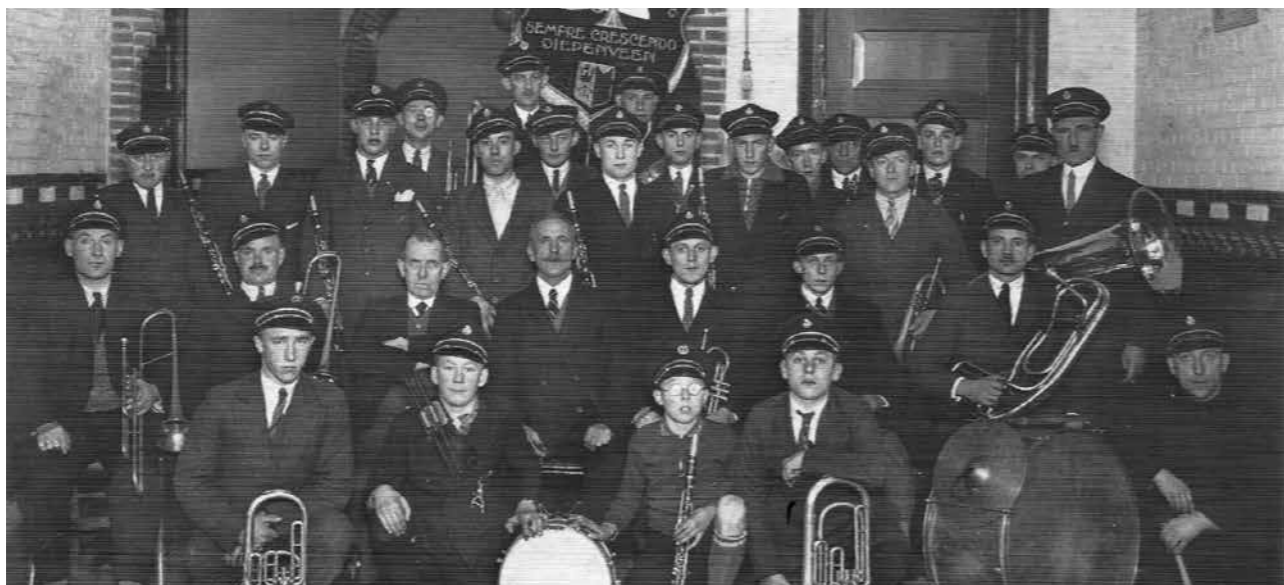
Sempre Crescendo in 1930 vereeuwigd in de gang van de toenmalige Lagere School.