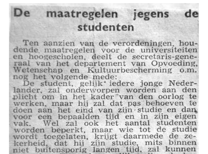
Deel van het krantenknipsel