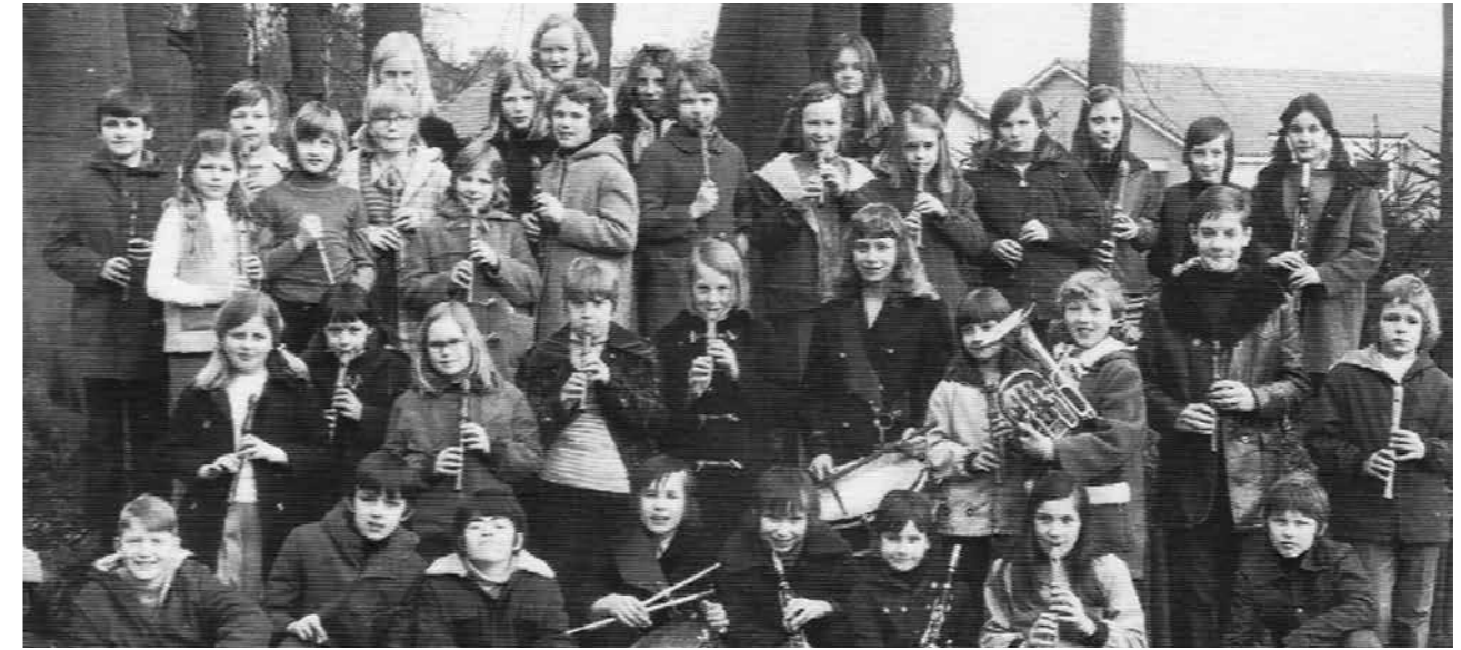
De grote leerlingenklas met het vijftigjarig jubileum in 1973.