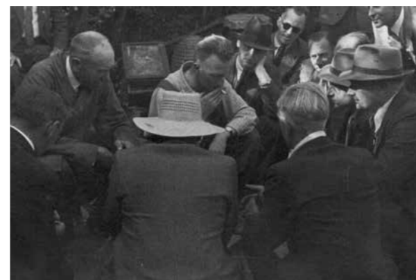
Rotterdamse belangstelling voor de Koershofkast (1948)

er mateloos over opwinden. Door de toegenomen verkoop kan hij niet alles zelf meer produceren. Hij moet elders inkopen en laat daarbij ook weer niets aan het toeval over. Altijd controleert hij of de kwaliteit van de afgeleverde honing wel in overeenstemming is met het proefmonster.