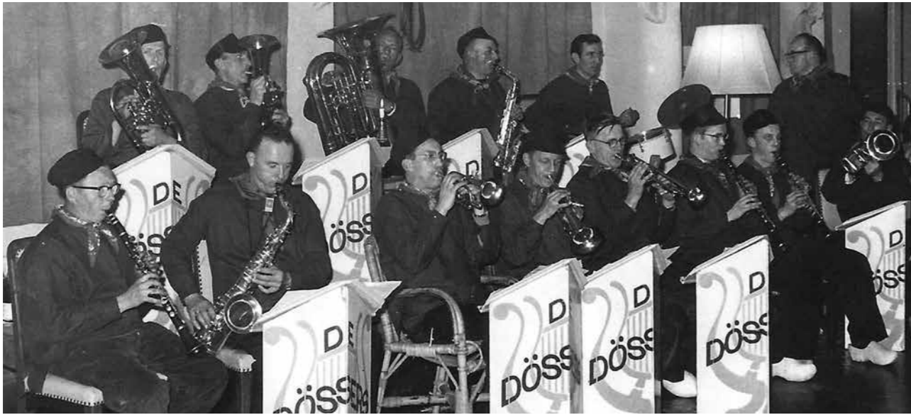
In 1954 werd "De Dössers" opgericht. Deze boerenkapel kreeg faam tot zelfs in Rotterdam.

de muziekvereniging weer midden in de Diepenveense samenleving. Dat wordt in het jubileumjaar ruimschoots gehonoreerd, als tijdens de receptie namens de bevolking een flink bedrag wordt aangeboden.