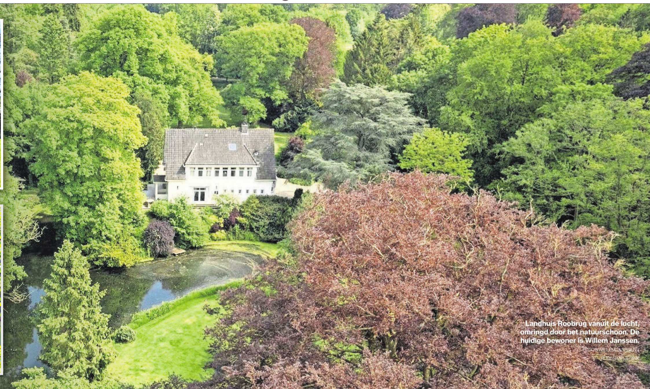
Landhuis Roobrug vanuit de lucht, omringd door het natuurschoon. De huidige bewoner is Willem Janssen.