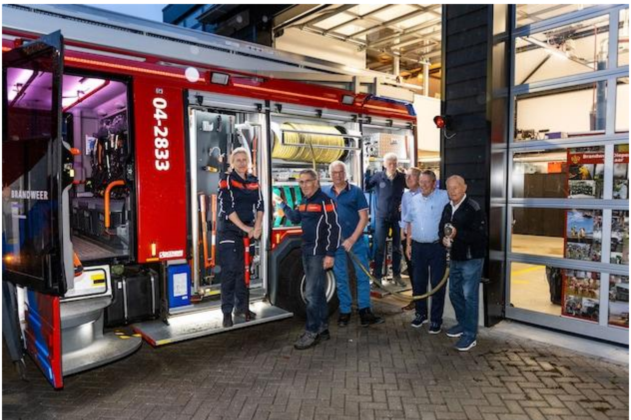
Diepenveen Brandweer bestaat 125 jaar