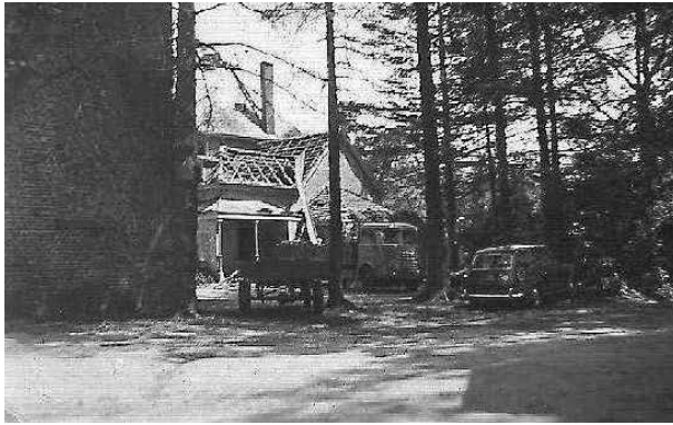
Aanzicht op de keuken waarvan de dakbedekking reeds is gesloopt. De auto rechts op de foto is de VW van vader Bornebroek