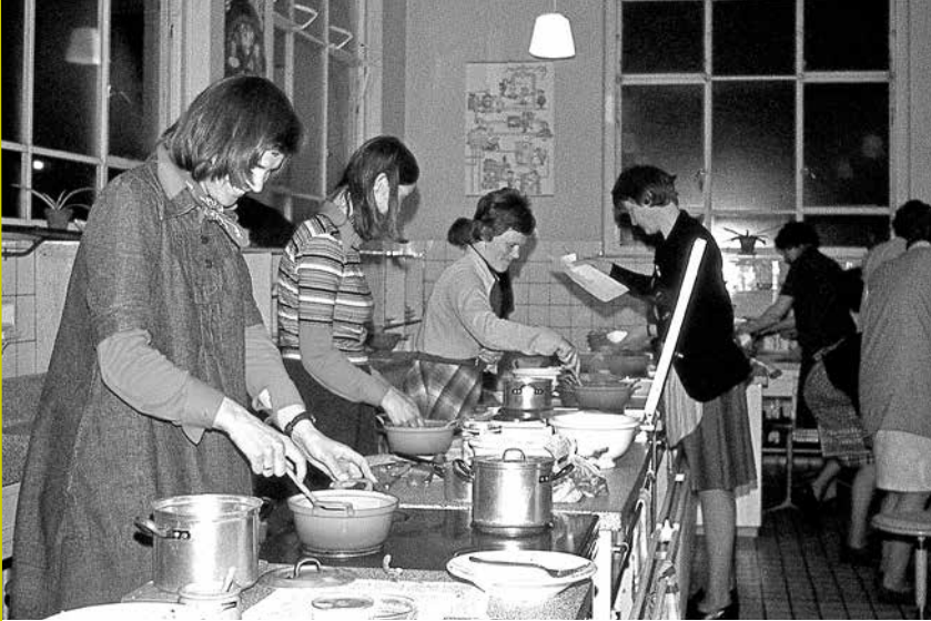
Vrouwen van Nu. Kookcursus 'Fijne keuken' in 1976 in de huishoudschool 'Den Roosen Enk' in Olst.