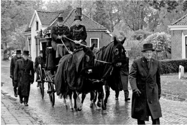
Lijkkooets met dragers zoals in 2012 bij het 80-jarig jubileum was te zien

De Diepenveense Begraffenisvereniging (DBV) bestond op 1 oktober jl. negentig jaar. Een heugelijke gebeurtenis dat weinig verenigingen is gegeven en daarom niet ongemerkt voorbij mag gaan.