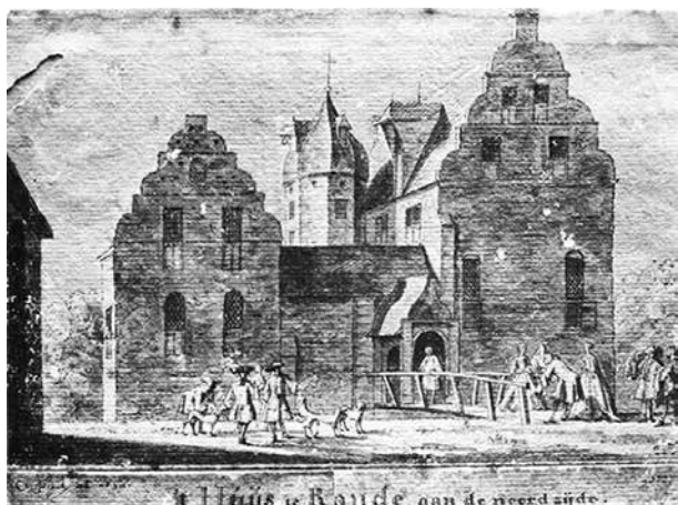
Havezathe Rande, getekend door Cornelis Pronk in 1727

Volgens Jan moet de komst van het adellijk geslacht van Rande in de 13e eeuw te maken hebben gehad met de nabijheid van Deventer, met zijn vestingwerken en tevens de belangrijkste plaats in Overijssel. Naast het kunnen zaken doen bood de stad ook bescherming, want in de middeleeuwen was het gebied van de marke Rande ruig en bebost en zeer dun bevolkt. Het huis van een familie van aanzien moest dus de status van een grootgrondbezitter tonen maar ook ongewenste personen buiten kunnen houden. Of er toen al een versterkt huis op de plek van de latere havezathe Rande heeft gestaan kon nooit worden bewezen maar werd wel aannemelijk geacht 8 . Met de tijdens de afbraak gedane vondsten lijkt het bewijs hiervoor te zijn geleverd. Met name vanwege de gevonden kloostermoppen en andere bouwmaterialen is Jan ervan overtuigd dat er vóór 1570 tenminste een versterkt huis, maar mogelijk iets van een kasteeltje heeft gestaan 9 .