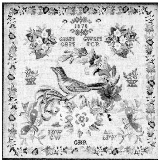
Merklap van de familie Harmelink