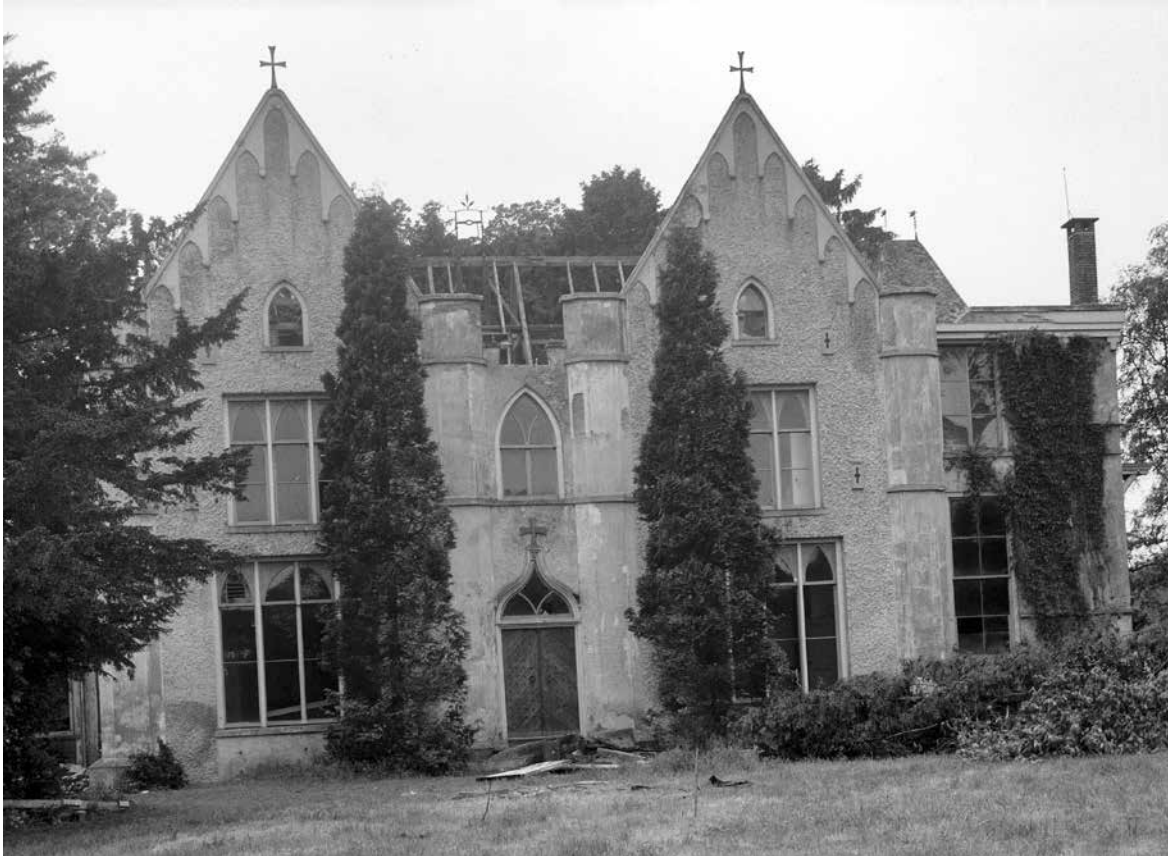
Landhuis Oud Rande waarvan het dak reeds is gesloopt.