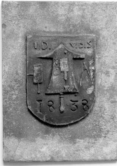
Trotseerloodje van I.D. van den Sigtenhorst, loodgieter en leidekker te Deventer, 1838 Afbeelding museum De Waag Deventer

den, etc. (bij het verwijderen zijn deze onbruikbaar beschadigd). De vloer van de hal bestond uit grote wit marmeren tegels. In de bijkeuken en in enkele andere dienstvertrekken lagen platen van tufsteen en Bentheimer zandsteen. Het huis was voor een groot deel, in ieder geval links en rechts van de voordeur, onderkelderd met gemetselde gewelven. De vloer van de kelder onder de grote zaal links van de voordeur bestond uit ongeglazuurde rode en zwarte esterikken. De wanden waren bekleed met groene en oranje geglazuurde esterikken 2 .