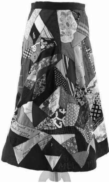
Nationale Feestrok van Mies Boissevain collectie Verzetsmuseum Amsterdam