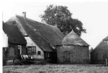
Boerderij 't Helderman te Diepenveen ca. 1950

toelichting. Het betreft slechts een greep uit het grote aantal beschikbare boerderijenfoto's en de keuze is willekeurig geweest. De fototentoonstelling is in het Kulturhus van 10 tot 30 november te bezichtigen.