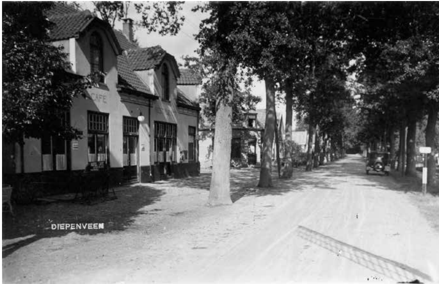
Café Bloemendal aan de Dorpsstraat

In dit artikel wordt de geschiedenis van 84 jaar Boerinnenbond/ Plattelandsvrouwenbond/ Vrouwen van Nu afdeling Diepenveen beschreven. Er wordt uitgebreid ingegaan op de jaren 1945-1950, waarvan de notulen bewaard zijn gebleven. Met enkele voormalige bestuursleden en het oudste lid, is een gesprek gevoerd over de wederwaardigheden van de Diepenveense afdeling in de jaren daarna. Ook wordt beperkt informatie gegeven over de landelijke organisatie.